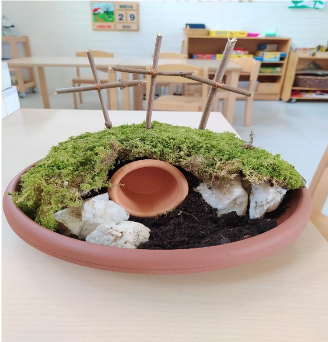
Grabhöhle Jesu auf unserem Osterweg im März 2022

Die Grundgedanken des christlichen Glaubens, ein friedliches und rücksichtsvolles Miteinander, Respekt und Achtung allen Menschen gegenüber möchten wir vorleben und vermitteln.